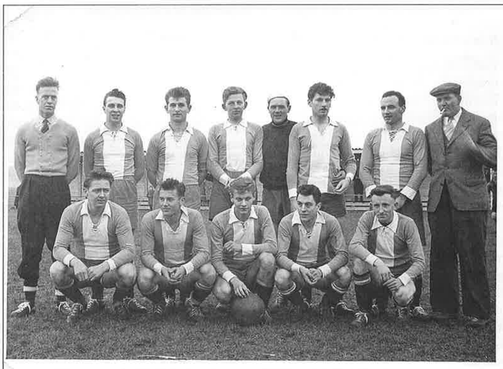
Foto van de ploeg uit 1958

Voor de Aalbeekse voetbalploeg is het uiteraard ook niet altijd rozengeur en maneschijn geweest. Niettemin is het bestuur de vele problemen en veranderingen te boven gekomen en dat pleit voor de hardnekkigheid waarmee gestreden moest worden. We grabbelen terug in de geschiedenis en brengen daarbij een aantal feitjes en anekdotes in herinnering.