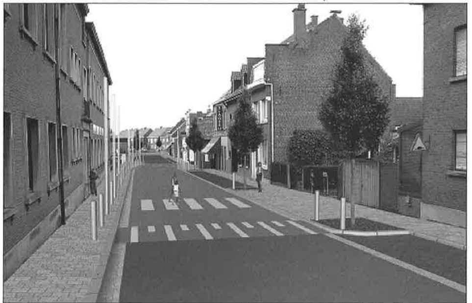
Zo zal de schoolomgeving in de Lauwsestraat er in 2011 uitzien.

Los van de geplande werken, zullen verderop in de Lauwsestraat ook