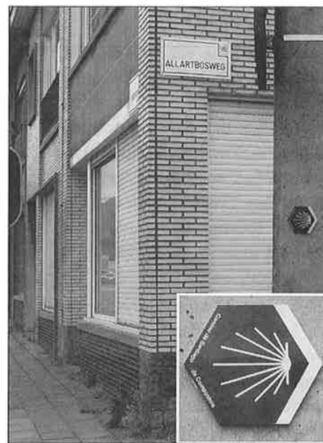
Ook aan de Allartbosweg vinden we een wegwijzer 'Camino' naar Santiago d Compostella